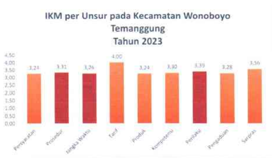
Tabel 2.5 Indeks Kepuasan Masyarakat (IKM) Kecamatan Wonoboyo Tahun 2023-2024 s.d Triwulan I

Sumber: PermenPAN & RB nomor 14 Tahun 2017