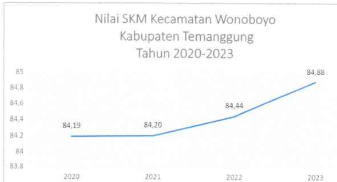
Tabel 2.6 Survey Kepuasan Masyarakat (SKM) Kecamatan Wonoboyo Tahun 2020-2024