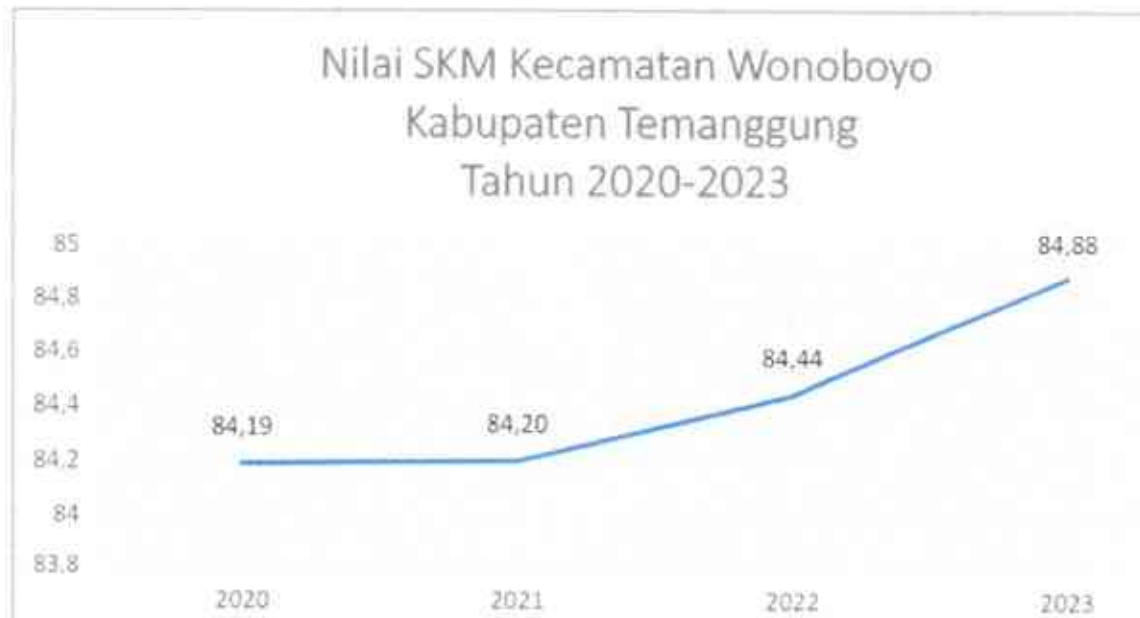
Tabel 2.6 Survey Kepuasan Masyarakat (SKM) Kecamatan Wonobojo Tahun 2020-2024